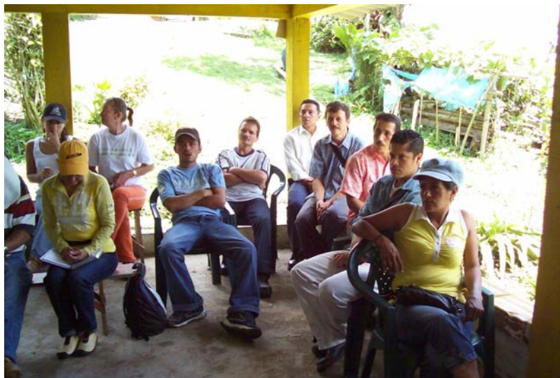
Reunión con los Productores socializando el PMS.